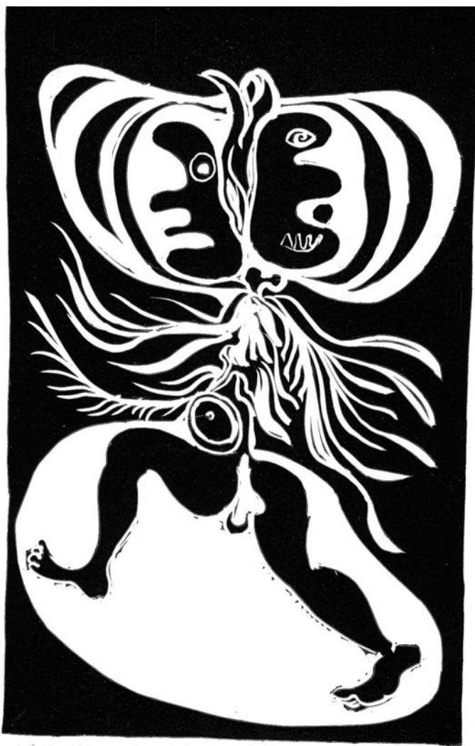
Jelenet a „Geneziszből” II.

* Részlet egy készülő monográfiából. Megjelenik az Osiris Kiadónál 2010-ben.