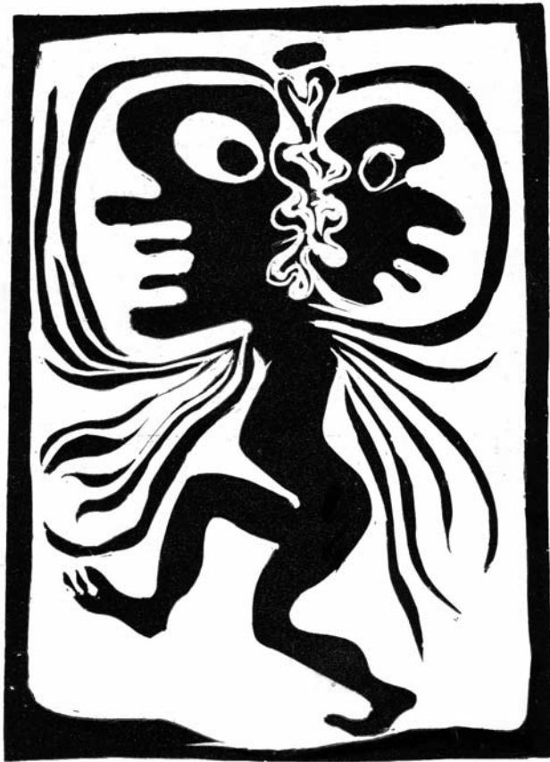
Jelenet a „Geneziszból” I.